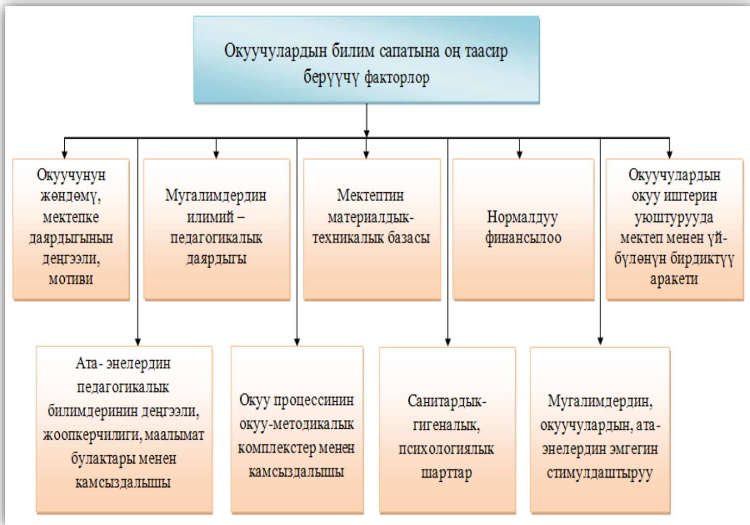
Сүрөт 1.1. Мектеп окуучуларынын билим сапатына оң таасир тийгизүүчү факторлор

Эми ушул факторлордун ар биринин мазмунуна кыскача токтололу: